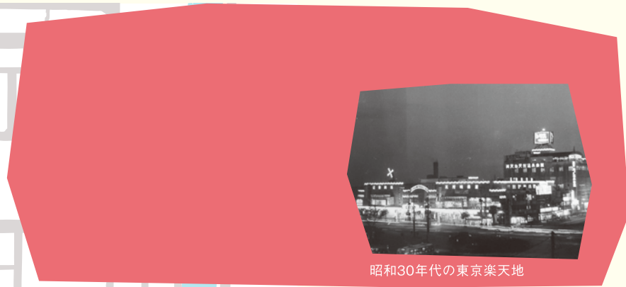
昭和30年代の東京楽天地